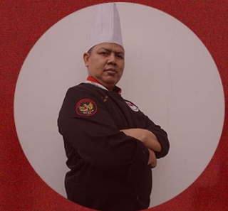
SOBUR Executive Sous Chef Holiday Inn Pasteur Bandung